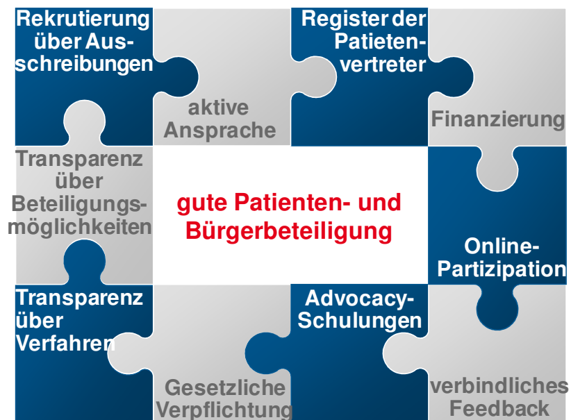
Abbildung 6: Bausteine der guten Praxis

Die Beispiele guter Beteiligungspraxis beziehen sich auf Maßnahmen und Instrumente. Somit können sie als Bausteine der guten Praxis der Patienten- und Bürgerbeteiligung gelten und helfen, die Rahmenbedingungen zu verbessern, die Verbindlichkeit und Transparenz zu erhöhen und letztlich die Legitimation der Patienten- und Bürgervertreter zu steigern.