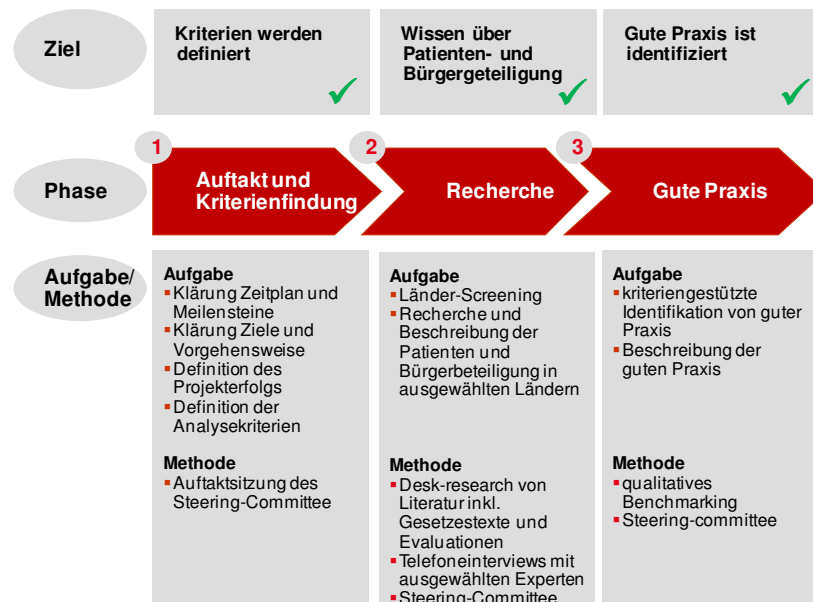
Abbildung 3: Studiendesign